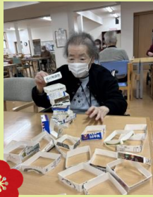
パック積み ゲーム